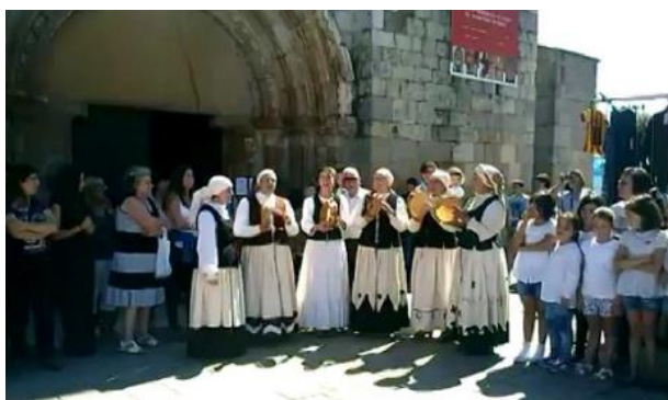
“Nove ferreñas” interpreta, por elas musicado, o poema de Avelino "Canzón pró sono dun neno":

Polas valgas i os outeiros a soma da noite cai i un agromar de luceiros o ceio amosando vai. E zoa, zoa, zoa, zoa zoando o vento polas veigas vai marmulando.