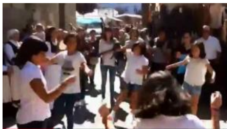
Grupo de baile da ANPA do colexio de Meira.

E alí estaban –non podían faltar!- gaiterías, pandeireteiras e bailadoras, xunguándose a nós coma quen se substancia e dignifica nun aturuxo irrefreable.