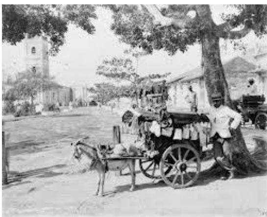
Cuba em 1920.

Volve para Meira en 1916, onde subsiste facendo de mestre en tres aldeas da contorna –sen título acreditativo oficial, o que era frecuente naquel tempo- e indo ás segas a Castela.